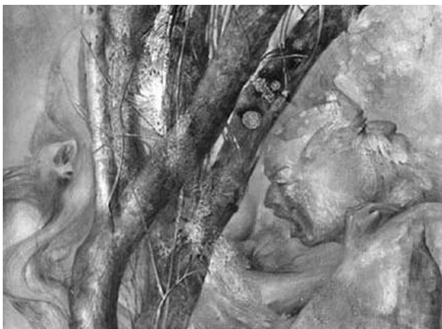
© J. Olivares, Laudépine pour Carnus , huile sur toile (détail)

Son titre fait référence à la fois à l'organisme vivant qu'est l'arbre et à la part d'imaginaire qu'il évoque à travers la mythologie ( Les Métamorphoses d'Ovide), l'histoire et les civilisations (Gréco-romaine, celtique, germanique et britannique) et l'art (peintures de Jaime Olivares).